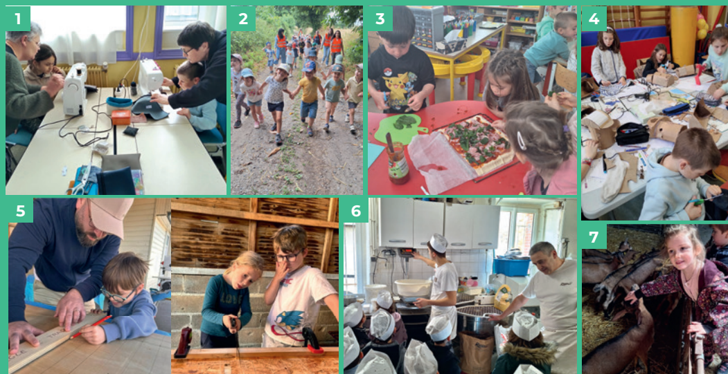
1. Atelier couture ; 2. Randonnée ; 3. Atelier cuisine ; 4. Atelier construction de marionnettes ; 5. Atelier menuiserie ; 6. À la boulangerie ; 7. À la chevrerie.