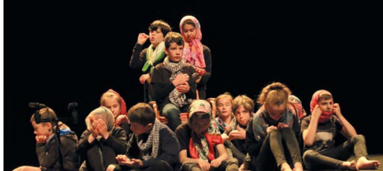
Les CM1-CM2 ont fait forte impression lors de leur représentation théâtrale

Également rendue possible par cette collaboration : l'organisation du concert de Mémé les Watts, avec la chorale des enfants en première partie, a été assurément le temps fort de l'année. Enfants et parents garderont un très bon souvenir de cette soirée emmenée par Pierre BOUGUIER.