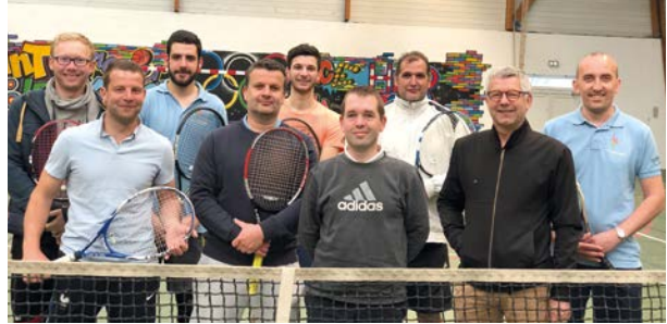
L'ensemble des équipes 1 et 2 lors d'une rencontre en championnat de printemps

Côté résultats sportifs, l'équipe 1, évoluant en 1 ère division départementale dans un championnat d'hiver relevé, a terminé 2 ème et monte pour la première fois en pré-région. L'équipe 2 qui évoluait en 2 ème division, a terminé 1 ère et monte en 1 ère division départementale.