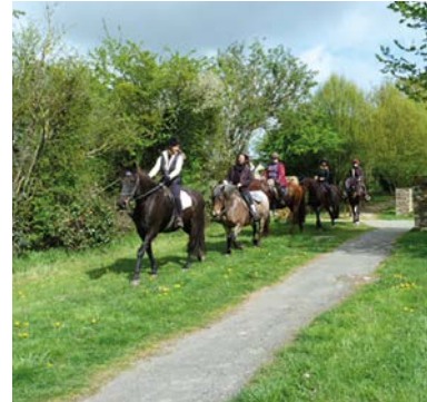
Environ 80 personnes aux randonnées pédestres, équestres et patrimoine organisées en avril à Ahuillé par l'Office de tourisme de Laval

comptable qui s'effectue maintenant du 1 er novembre au 30 octobre, avec le renouvellement des licences valides du 1 er janvier au 31 décembre, et à la demande de subvention adressée à la mairie en janvier.