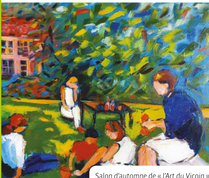
Salon d'automne de « l'Art du Vicoin »

Répétition de chants : l'équipe de liturgie propose une répétition de chants à 20 h 30 à L'Huisserie le 1 er mardi de chaque mois ; une seconde répétition est programmée le 2 ème mardi de chaque mois à 14 h à L'Huisserie.