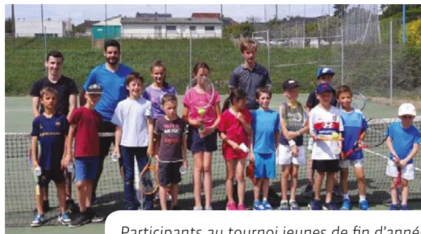
Participants au tournoi jeunes de fin d'année