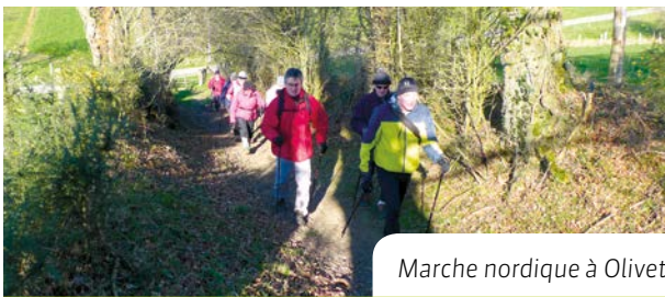
Marche nordique à Olivet