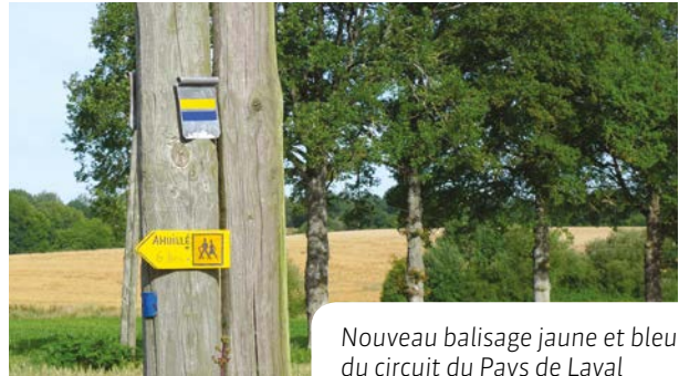
Nouveau balisage jaune et bleu du circuit du Pays de Laval